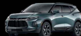
Gris Jade Metálico