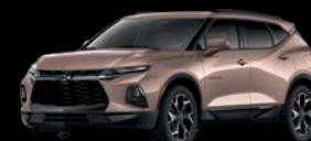
Café Roble Metálico