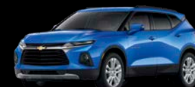
Azul Cobalto Metálico**