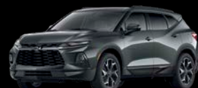
Gris Basalto Metálico